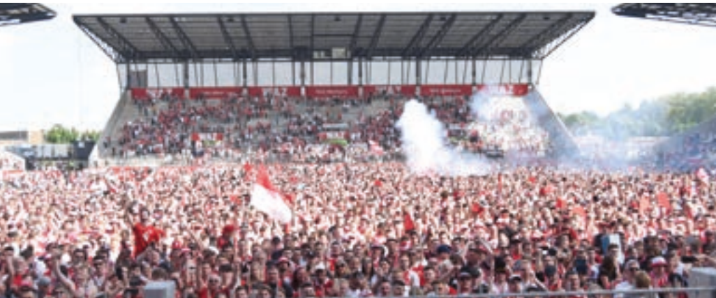
^ In allen Stadien, wo Aufstiege oder Meisterschaften gefeiert werden, immer dieselben Bilder: Der Platz wird gestürmt, auch bei Rot-Weiss Essen.