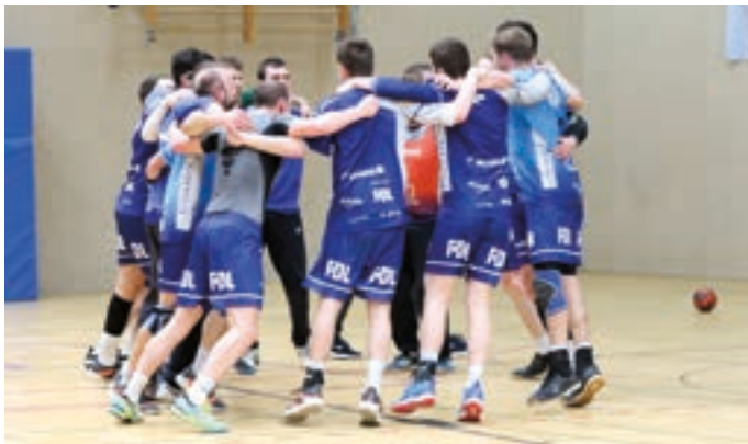
↗ Fünf Jahre nach dem Aufstieg in die Verbandsliga schafften die Handballer des VfR Saarn wieder den Aufstieg. Nach dem entscheidenden Spiel gegen die Spielvereinigung Velbert/Heiligenhaus war die Freude riesengroß.

Die Geschichte der B-Kreisligisten ist schnell erzählt. Lediglich der TSV Heimaterde und der SV Raadt 2 steigen auf, absteigen müssen die zweiten Mannschaften des SV Heißen und TSV Heimaterde. Die Frauen-Fußballerinnen des SV Heißen konnten in der Niederrheinliga im letzten Moment den Abstieg vermeiden. Die Aufsteigerinnen von Blau-Weiß aus Mintard waren mit Rang zwei in der Landesliga zufrieden.