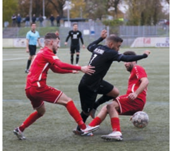
↗ Die Begegnungen zwischen dem Mülheimer FC 97 und dem VfB Speldorf sind meistens von Kampf geprägt. Hier eine Szene aus dem Saisonspiel im Ruhrstadion, das 2:1 für den Mülheimer FC 97 endete.

Von den sieben Mülheimer A-Kreisligisten stiegen gleich zwei Mülheimer Teams ab: SV Heißen und Dümptener TV. Alle anderen Mannschaften platzierten sich im Mittelfeld.