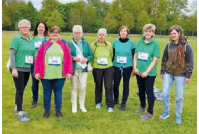
Die Läuferinnen aus dem Frauenausschuss des MSB.

nen Menschen oder die Fahrt in die alte Heimat. Damit der „Wünschewagen“ gut ankommt, hat er nicht nur ein gutes Fahrwerk, sondern auch einen leuchtenden Sternenhimmel, Sterne auf den Fenstern und Bettwäsche mit Sternchen. Der „Wünschewagen“ finanziert sich ausschließlich über Spenden.