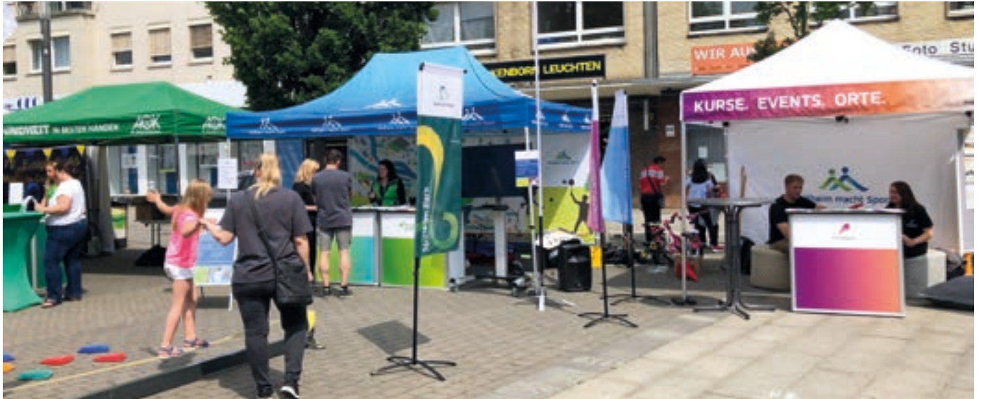
Der „Tag des Sports“ hielt Angebote sowohl für Kinder und Jugendliche als auch für Erwachsene jeden Alters bereit.

Insgesamt 15 Mülheimer Sportvereine nutzten am 7. Mai die Möglichkeit, im Rahmen des „Tag des Sports“ auf ihre vielfältigen Angebote aufmerksam zu machen und darüber mit den Bürgerinnen und Bürgern ins Gespräch zu kommen. Nachdem die Veranstaltung im Jahr 2020 pandemiebedingt ausfallen musste und auch 2021 nicht nachgeholt werden konnte, gab es in diesem Jahr endlich wieder in der gesamten Mülheimer Innenstadt Mitmachaktionen in verschiedenen Sportarten, Vorführungen der Sportvereine auf einer Bühne sowie vielfältige Informationen rund um das Sportgeschehen in Mülheim an der Ruhr. Die folgenden Vereine machten bei dem Event mit: