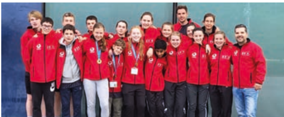
Das komplette Team der Luisenschule.

Beide Teams der Luisenschule freuten sich nach der längeren Corona-Auszeit sehr über ihre Qualifikation für das Finale des Wettbewerbes JUGEND TRAINIERT FÜR OLYMPIA, denn sie waren seit 2015 eigentlich Dauergast in Berlin.