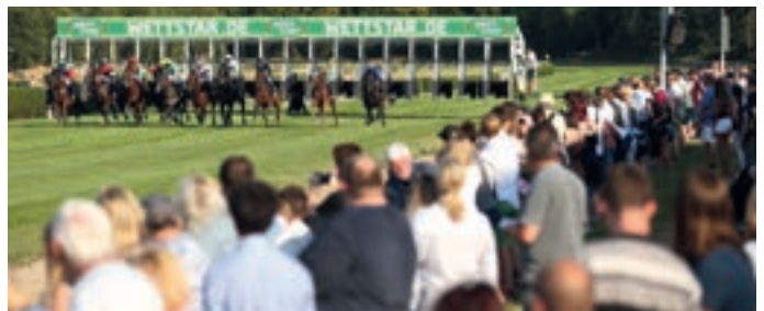
^ Kennzeichnend für die ersten beiden Renntage in 2022: Guter Besuch.

Die nächste Galoppveranstaltung in Mülheim findet am Sonntag, 17. Juli 2022 statt. Dann steht mit dem BBAG Diana-Trial auch das erste Black Type-Rennen der Mülheimer Saison an.