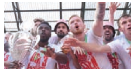
^ Der Jubel im Stadion an der Hafestraße kannte keine Grenzen.

„Dass ich das noch erleben durfte“, waren Kommentare von zahlreichen Fans. Und das hat auch seine Berechtigung, denn der Gewinn der Deutschen Meisterschaft und des Pokalsieges liegen nahezu 70 Jahre zurück. Die 1. Bundesliga mussten sie vor über 40 Jahren verlassen.