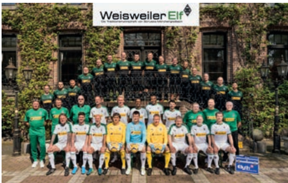
^ Das ist die sogenannte Weisweiler-Elf von Borussia Mönchengladbach.

Die Begegnung beginnt um 16.00 Uhr, der Eintritt beträgt fünf Euro für Erwach-